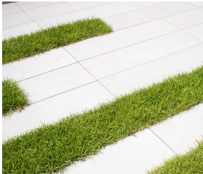
Камені мощення 1000x300x45. ЖК "Рибальський" м. Київ