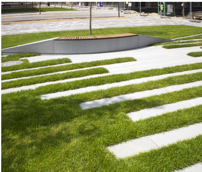
Камені мощення 1000x300x45. ЖК "Рибальський" м. Київ

Застосовуваний нами бетон має ущільнену структуру на молекулярному рівні, за рахунок чого він має низьку пористість і високу міцність в порівнянні зі звичайним бетоном.